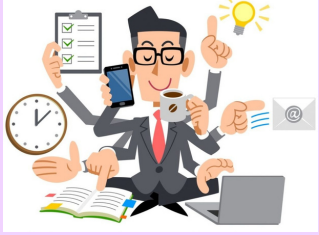
กิจการเจ้าของคนเดียว