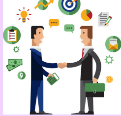
ห้างหุ้นส่วน สามัญ/จำกัด