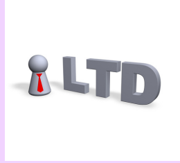
บริษัทจำกัด